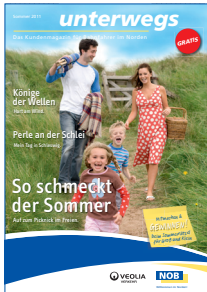
Titel der Ausgabe 2/2011